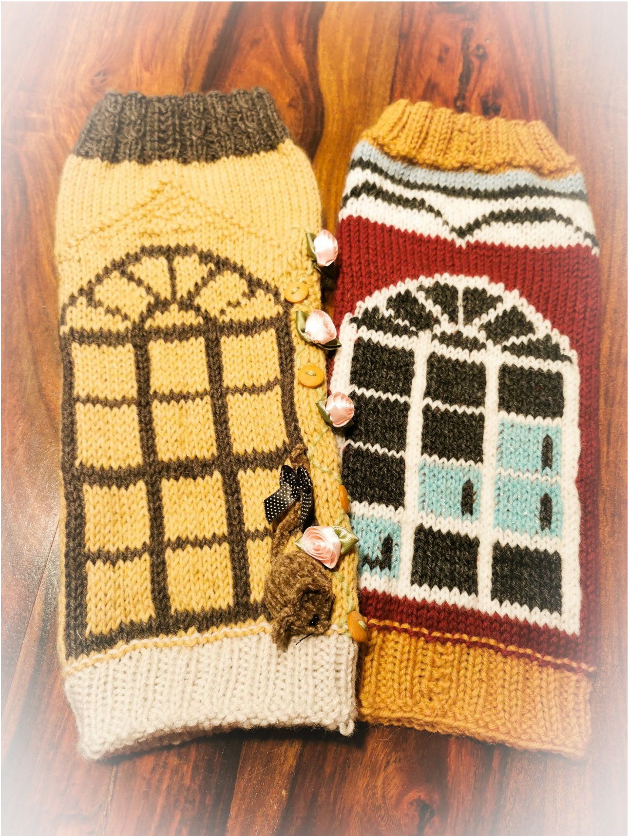
Lohtajan Ikkuna extrakoristellut Rautarinsessat ja Ullavan Säärystinversiot